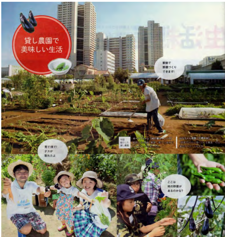
①オークファームの農園では高層マンションが並ぶ駅前からすぐの立地で有機栽培ができる②食育のために始めたら、親のほうがハマってしまっケースも③オークファームの週末農業体験は、子どもたちにも人気④はなちゃん農園を利用するY&Aの農園ではゴーヤ、オクラ、ししとう、ナスなどの夏野菜を無農薬で育てて収穫している