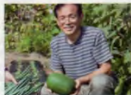
Y&A (夫60代、妻60代) 「高層の高層のそばに」と東京都東久留米市から三郷中央で新築マンションを購入。出屋を控えた縁が整理中